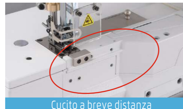
Cucito a breve distanza

Meccanica ed elettronica integrata, permettono di rendere la macchina più facile da operare