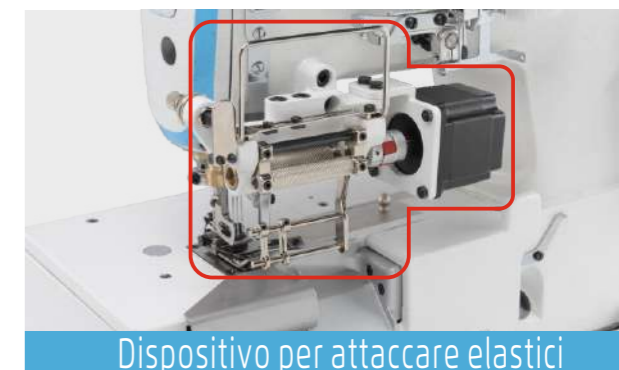
Dispositivo per attaccare elastici