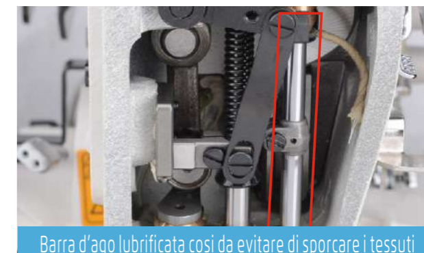
Barra d'ago lubrificata così da evitare di sporcare i tessuti