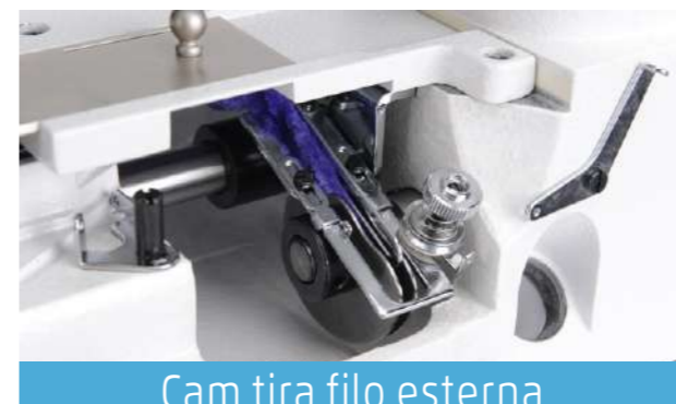
Cam tira filo esterna